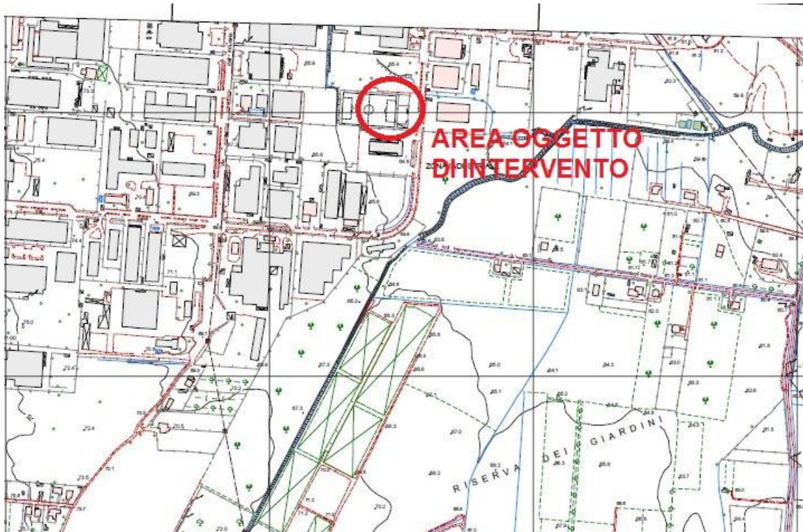
STRALCIO PLANIMETRIA CTR N. 399042