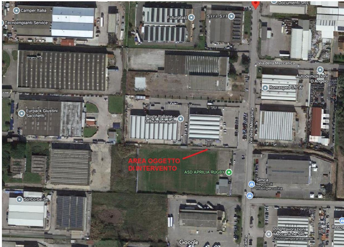
STRALCIO PLANIMETRIA UBICATIVA